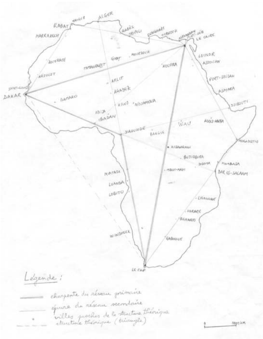
Figure 1. Le réseau routier et ferroviaire panafricain sous forme d'un triangle isocèle renversé (structure théorique à géométrie variable)